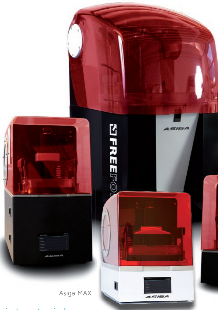
Asiga Freeform PRO2